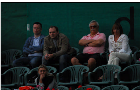
unten rechts: das Team der Cocktail Bar